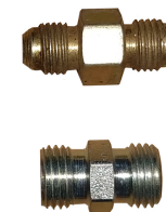
Adaptadores M14 e JIC37