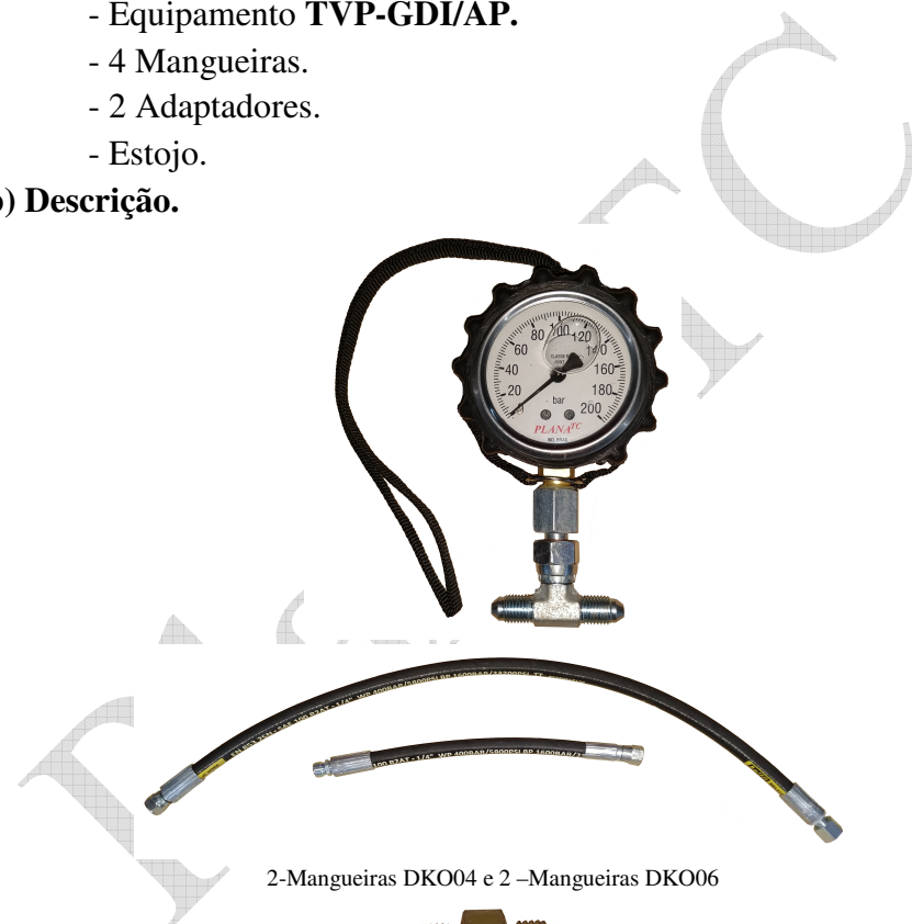
2-Mangueiras DK004 e 2 -Mangueiras DK006